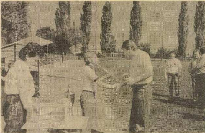
Eredményhirdetés és díjkiosztás