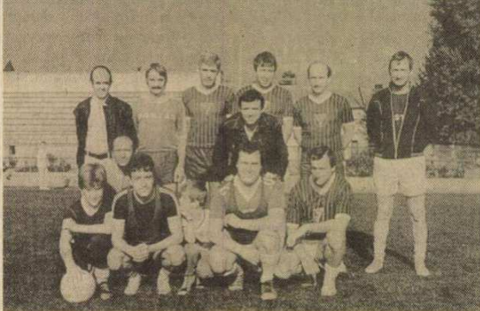
A győztes focicsapat