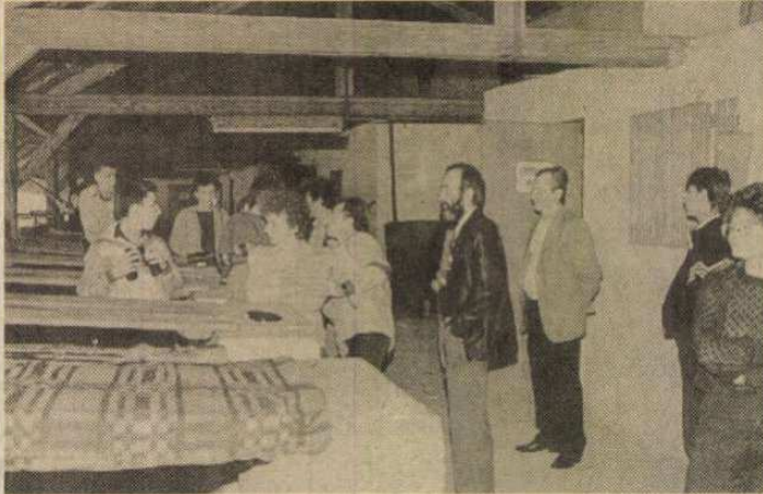
Vajon hány kört lőttem?