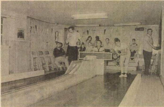
Itt nem könnyű gurítani